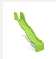
RU.050.15.W Anbaurutsche mit Welle, H 150 cm