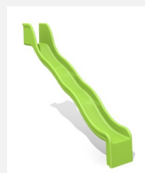
RU.050.20.W Anbaurutsche mit Welle, H