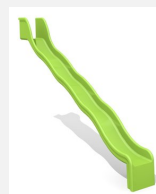
RU.050.25.W Anbaurutsche mit Welle, H