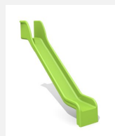
RU.050.16 Anbaurutsche gerade, H 175