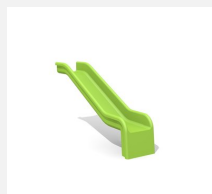
RU.050.10 Anbaurutsche gerade, H 100 cm