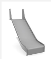
RU.090.15.B bimbo Anbaurutsche