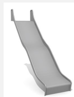
RU.090.25.W.E bimbo Wellenrutsche