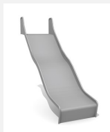
RU.090.20.W.B bimbo Wellenrutsche