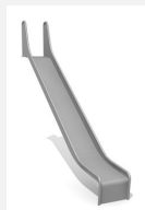
RU.090.20 bimbo Anbaurutsche