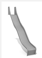
RU.090.20.W bimbo Wellenrutsche