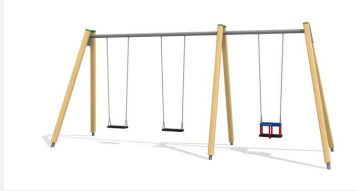
SC.071.3 3er Schaukel Holz-Metall