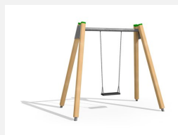
SC.070.1 1er Schaukel Holz-Metall 190 cm