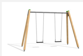
SC.071.2 2er Schaukel Holz-Metall