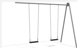
SC.120.8 2er Metallschaukelanbau verzinkt