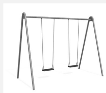
SC.121.2 2er Metallschaukel verzinkt