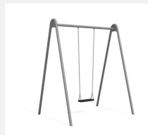
SC.121.1 1er Metallschaukel verzinkt