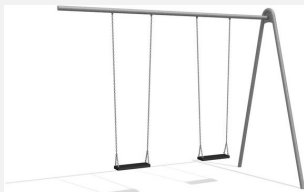
SC.120.8 2er Metallschaukelanbau verzinkt