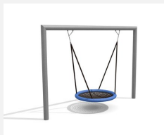
SC.162.3 Das Nest im Quader