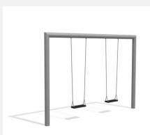
SC.160.2 2er Quaderschaukel