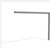
SC.160.09 2er Anbauelement (exkl. Einhängeteile)