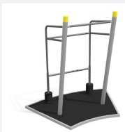
SF.1314 Gewichtheber m. Bodenplatte