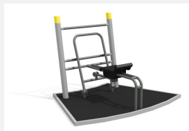
SF.1311 Sport Ruderer m. Bodenplatte