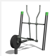
SF.1112 Sport Crosstrainer