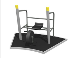
SF.1313 Sport Bike m. Bodenplatte