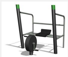
SF.1113 Sport Bike