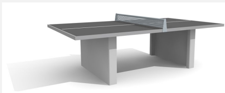
SP.010.12.A Tischtennis Polymerbeton anthrazit