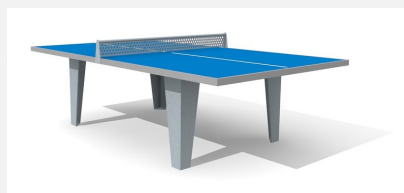
SP.010.11.B Tischtennis Polymerbeton, Stahlgestell blau