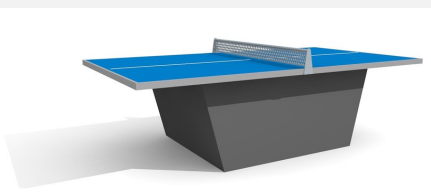
SP.010.13.B Tischtennis box, mit Metallunterbau blau