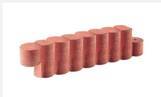
SW.020.09 Sandkasten Kettenelement 100 x 40 cm