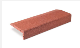
SW.022.1 Sandkastenwinkel 100 x 40 x 14 cm