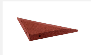
SW.022.2 Sandkastenwinkel Ecke