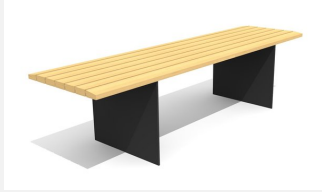
BT.045.T3.C Tisch Plano 300 color