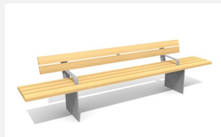
BT.045.BA3 Bank Plano 300 mit Armlehne