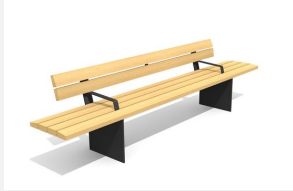
BT.045.BA3.C Bank Plano 300 mit Armlehne - color