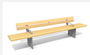
BT.045.BA3 Bank Plano 300 mit Armlehne