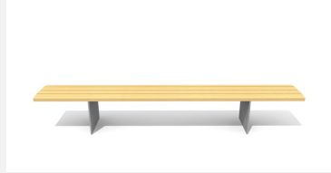
BT.045.H3 Hockerbank Plano 300