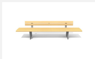
BT.045.B3 Bank Plano 300