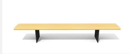
BT.045.H3.C Hockerbank Plano 300 color