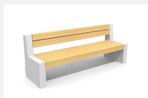
BT.151.B.22 Bank Versi Beton 220