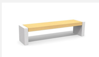
BT.151.H.22 Hockerbank Versi Beton 220