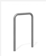
DI.106.15 Fahrradbügel Tube 55.1