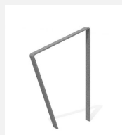
DI.108.16 Fahrradbügel Areo 65.1