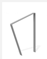
DI.108.16.I Fahrradbügel Areo 65.1 inox