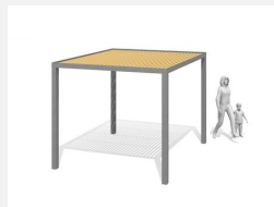
WS.200.1 Pavillon Cubo wood 1