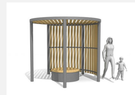
WS.200.90 Pavillon Cubo wood nach Mass