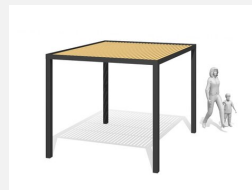
WS.200.1.C Pavillon Cubo wood 1 - color