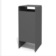
AB.041.21.A Verso quader 100 L mit Ascher color