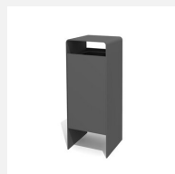
AB.041.11 Abfallbehälter Verso quader 50 L