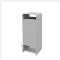
AB.041.10 Abfallbehälter Verso quader 50 L