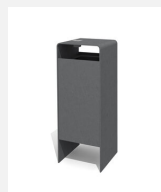
AB.041.11.A Abfallbehälter Verso quader