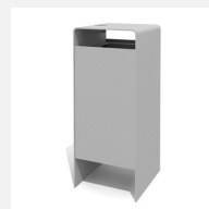
AB.041.20.A Verso quader 100 L mit Ascher