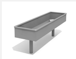
SW.141.40 Wasserbecken 150 x 40