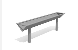
SW.141.50 Wasserrinne 150 gerade