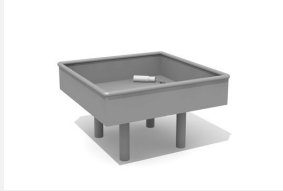
SW.141.41 Wasserbecken 80 x 80