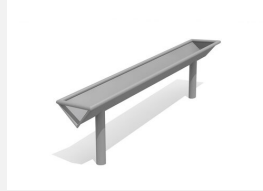
SW.141.51 Wasserrinne 150 schräg