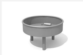
SW.141.31 Wasserbecken rund