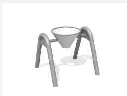
SW.146.40 Kippeimer mit Doppelbogen