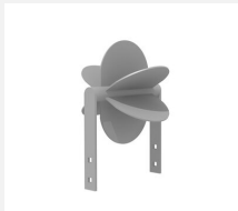
SW.146.10 Wasserrad simple