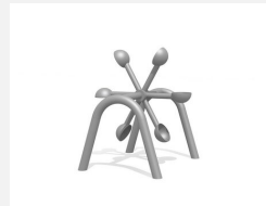
SW.146.20 Löffelrad 6 klein mit Doppelbogen