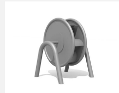
SW.146.31 Wasserrad geschlossen mit Doppelbogen