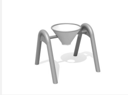
SW.146.40 Kippeimer mit Doppelbogen