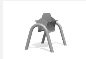
SW.146.11 Wasserrad offen mit Doppelbogen