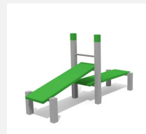
SWC.4115 Doppelbank 115