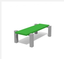
SWC.4112 Bank 112