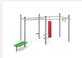
SWC.4953 HIT Training 953