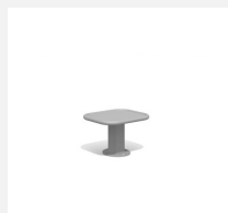
SWC.4964 Jump Platform 300