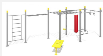
SWC.4967 HIT Training 967