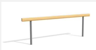
BA.020.9 Poutre d'équilibre plane 90 cm