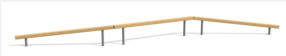
BA.021 Poutre d'équilibre - montagne et vallée