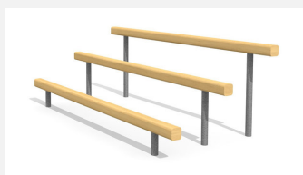
BA.022 Le pas de l'ours