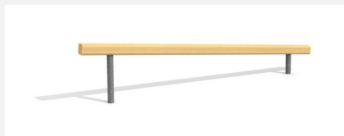
BA.020.1 Poutre d'équilibre inclinée 30-60 cm