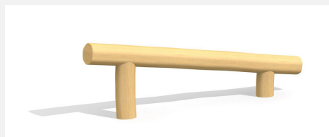
BA.020.1.R Poutre d'équilibre inclinée - nature