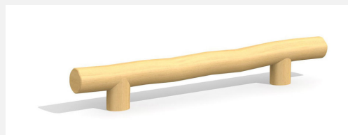
BA.020.3.R Poutre d'équilibre plane 30 cm nature