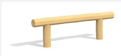
BA.020.6.R Poutre d'équilibre 60 cm - nature