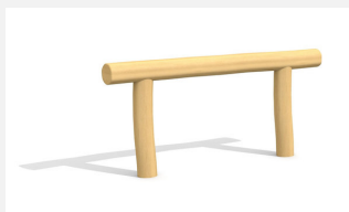
BA.020.9.R Poutre d'équilibre plane 90 cm - nature