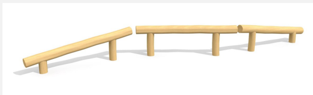
BA.021.R Poutre d'équilibre - montagne et vallée nature