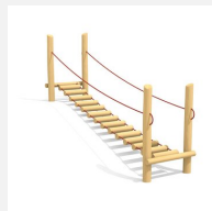
BA.056.04.R Traverse chancelante 400