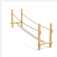
BA.056.14.R Traverse chancelante avec