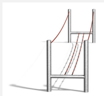
BA.056.14 Traverse chancelante avec corde 400 cm