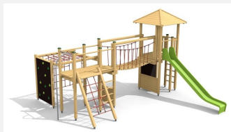
BM.060.1 Complexe de jeux Stans