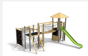
BM.060.1.M Complexe de jeux Stans classic steel