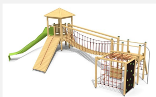
BM.060.2 Complexe de jeux Stans - Colline