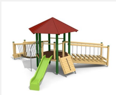
BM.070.3.L Tour à grimper Hagendorn 3 - lasure