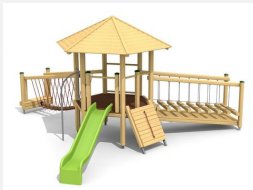
BM.070.3 Tour à grimper Hagendorn 3