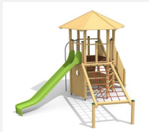
BM.070.1 Tour à grimper Hagendorn 1