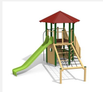
BM.070.1.L Tour à grimper Hagendorn 1 -