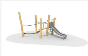
BN.021.12 Paysage de cordes bas 12