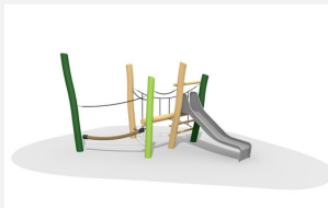
BN.021.12.L Paysage de cordes bas 12 - lasuré