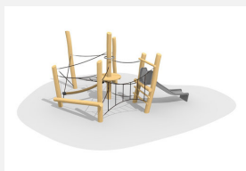
BN.021.16 Paysage de cordes bas 16