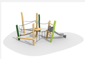
BN.021.16.L Paysage de cordes bas 16 - lasuré