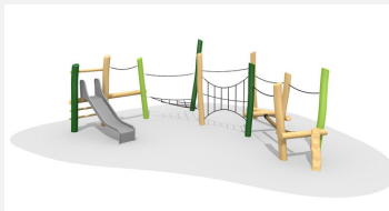
BN.021.14.L Paysage de cordes bas 14 - lasuré