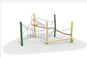
BN.022.3.L Paysage de cordes 3 - lasuré