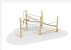
BN.022.3 Paysage de cordes 3