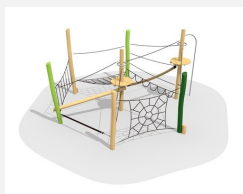
BN.022.7.L Paysage de cordes 7 - lasuré