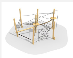
BN.022.7 Paysage de cordes 7