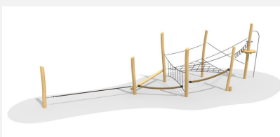
BN.022.5 Paysage de cordes 5