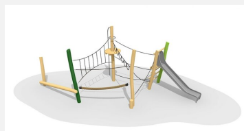
BN.023.13.L Paysage de cordes 13 - lasuré