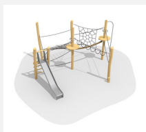
BN.023.15 Paysage de cordes 15