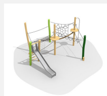
BN.023.15.L Paysage de cordes 15 - lasuré