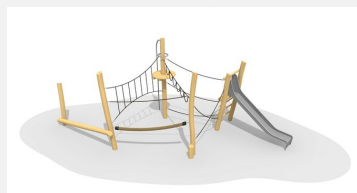
BN.023.13 Paysage de cordes 13