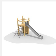
BN.070.04.A Affût perché avec toboggan inox