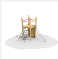
BN.070.02.A Affût perché avec barres de glisse