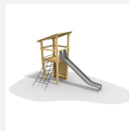
BN.070.04.B Affût perché avec toboggan inox et