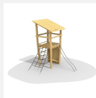
BN.070.02.B Affût perché, barres de glisse et