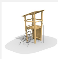
BN.070.01.B Affût perché toit à 1 pan