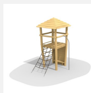
BN.070.01.C Affût perché toit à 4 pans