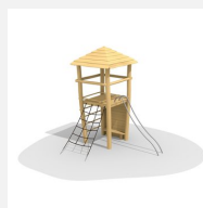
BN.070.02.C Affût perché, barres de glisse et