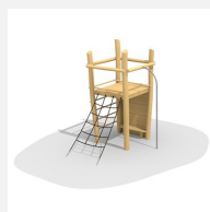
BN.070.01.A Affût perché sans toit