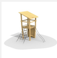
BN.070.02.B Affût perché, barres de glisse et