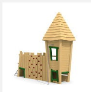
BN.134.1 Petit château 1