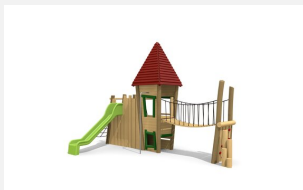
BN.134.2.L Petit château 2 - lasuré