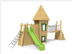
BN.134.2 Petit château 2