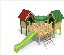
BS.030.2.L Village-grotte - lasure en couleur