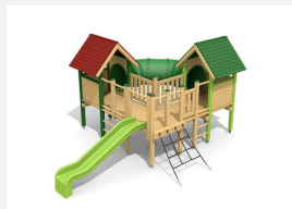
BS.030.2.L Village-grotte - lasure en couleur