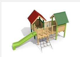
BS.030.L Village de jeux 1 - lasure en couleur