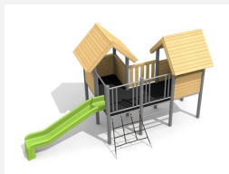
BS.030.HM Village de jeux 1 classic steel