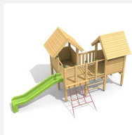
BS.030 Village de jeux 1