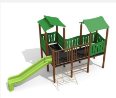
BS.030.MC Village de jeux 1 steel color