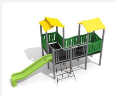
BS.030.M Village de jeux 1 steel