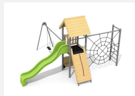
BS.080.1.HM Tour à grimper 1 avec 1 balançoire classic steel