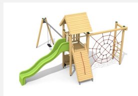
BS.080.1 Tour à grimper 1 avec balançoire