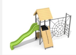
BS.080.HM Tour à grimper 1 classic steel