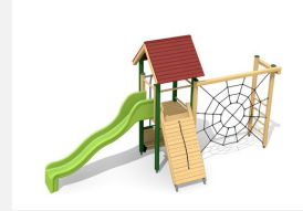
BS.080.L Tour à grimper 1 - lasure en couleur