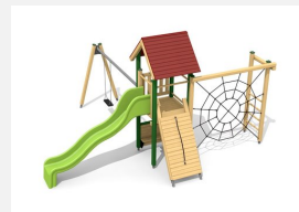
BS.080.1.L Tour à grimper 1 avec balançoire lasure coulé