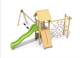
BS.080.2 Tour à grimper 1 avec balançoire à 2 places