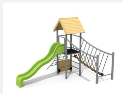
BS.100.1.HM Paysage à grimper 1 sur une colline classic steel